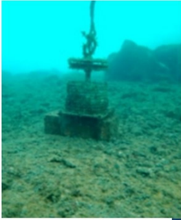
(B) Prototypes coast